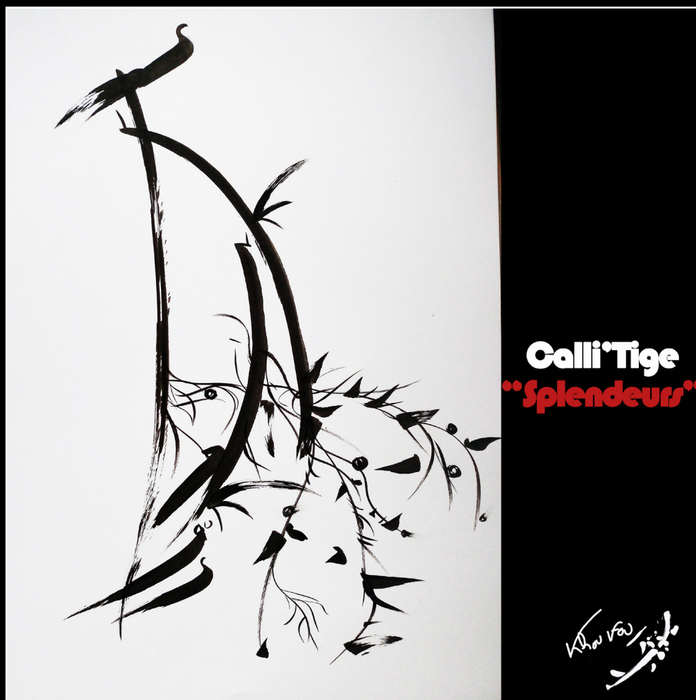
Collection "Calli'Tige" (2022-2023) - Dessin, encre de Chine sur papier - Tableau sous cadre -