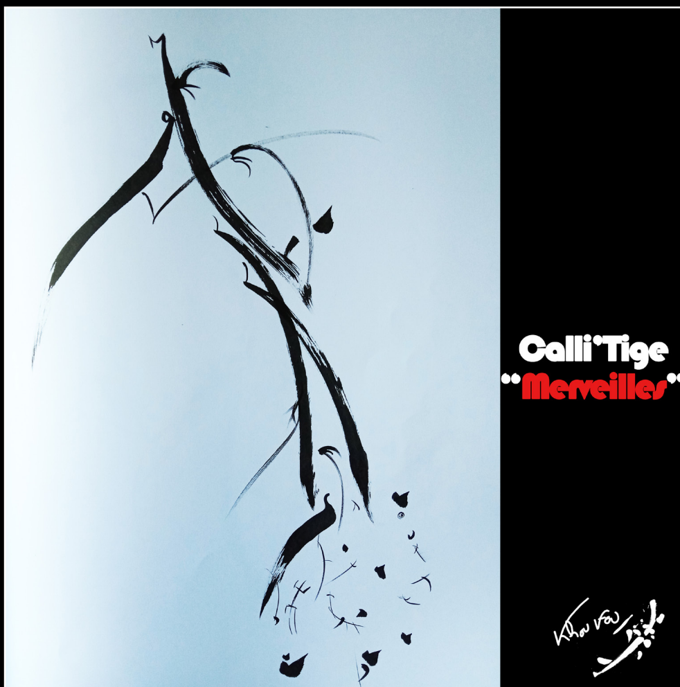
Collection " Calli'Tige " (2022-2023) - Dessin, encre de Chine sur papier - Tableau sous cadre -