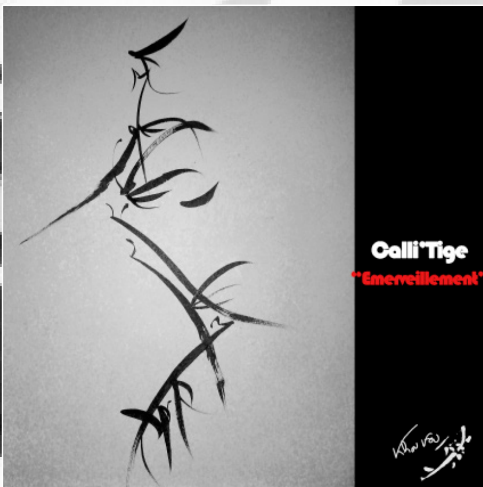
Collection " Calli'Tige " (2022) - Dessin, encre de Chine sur papier - Tableau sous cadre -