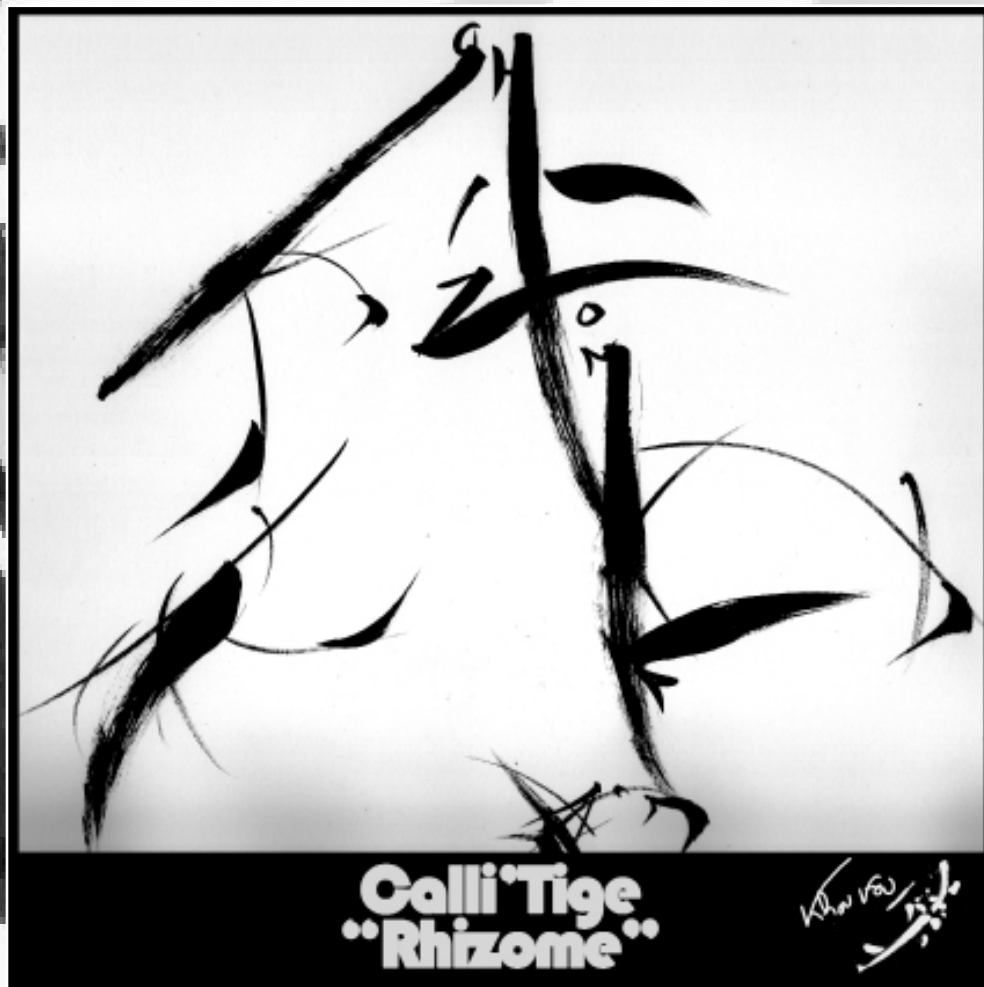
Collection " Calli'Tiger " (2022) - Dessin, encre de Chine sur papier - Tableau sous cadre -