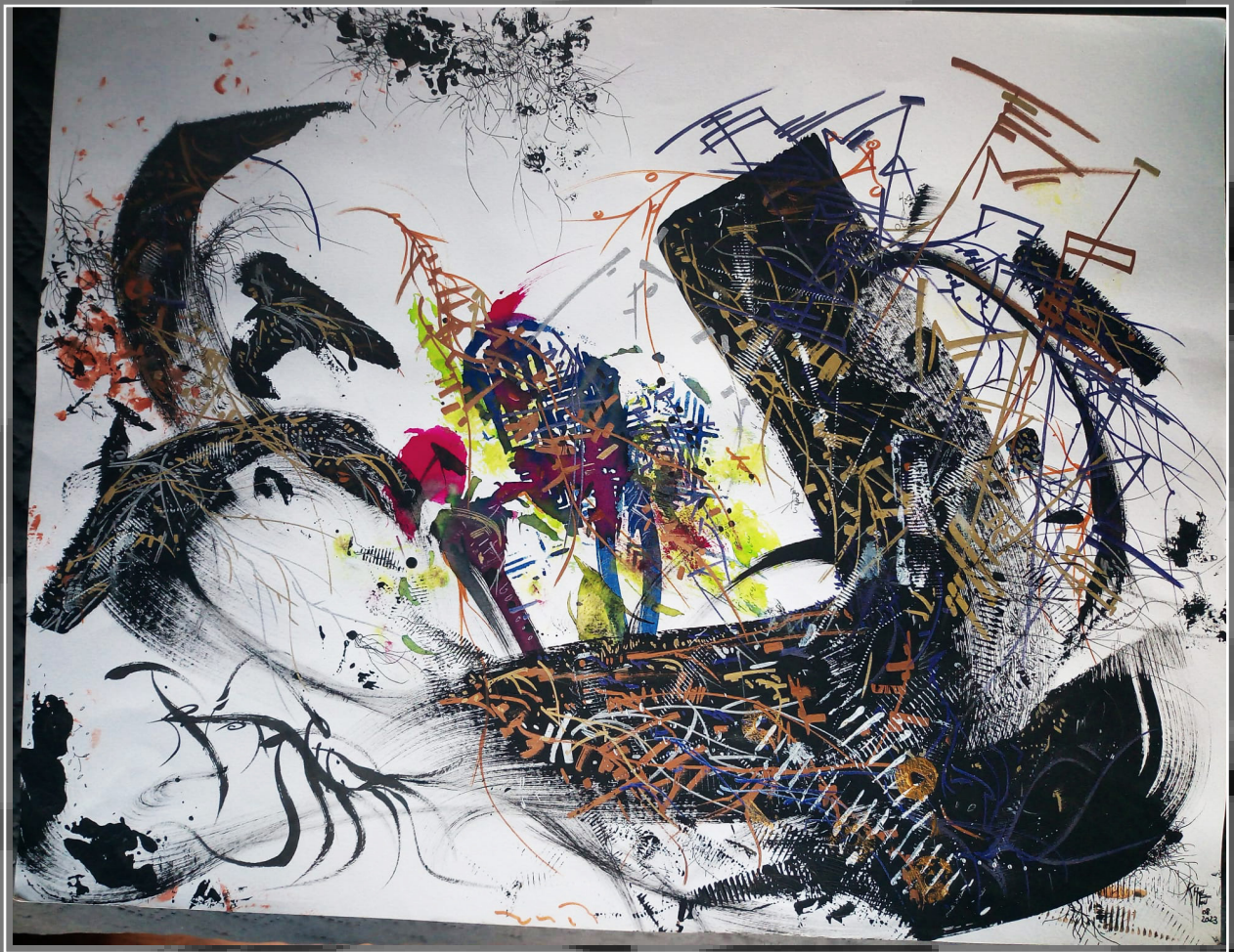
Collection " Voyages calligraphiques " (2023) - Dessin, encre de Chine sur papier/marqueurs