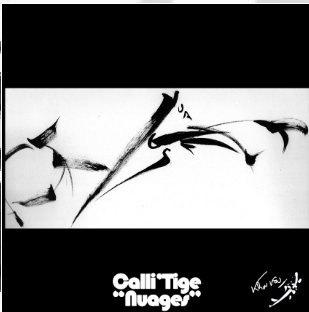
Collection " Calli'Tiger " (2022) - Dessin, encre de Chine sur papier - Tableau sous cadre -